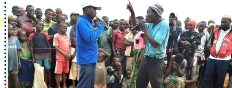
Les jeunes et les adolescents en âge de procréer ainsi que la population la plus vulnérable et démunie