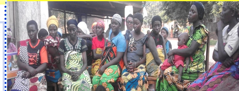
Femmes enceintes et allaitantes