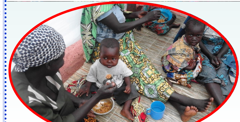
Les enfants de moins de 5 ans